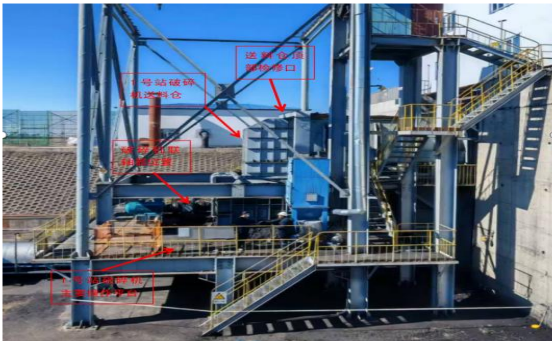
图2 1号站1号破碎机侧面现场照片